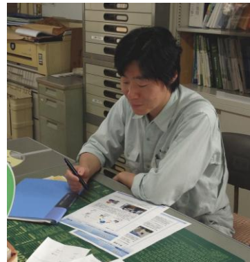
左： 実際に「smart position」 をご利用頂いている風景